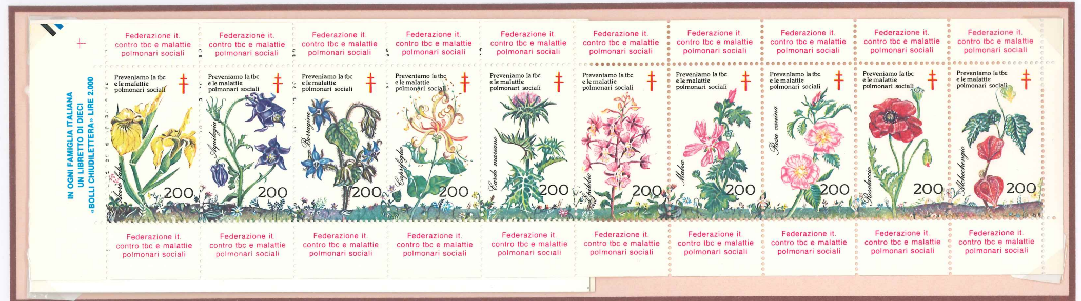
Emissione di un Libretto composto di 10 chiudilettera disposti su una striscia orizzontale. Il un valore facciale è di 200 lire.