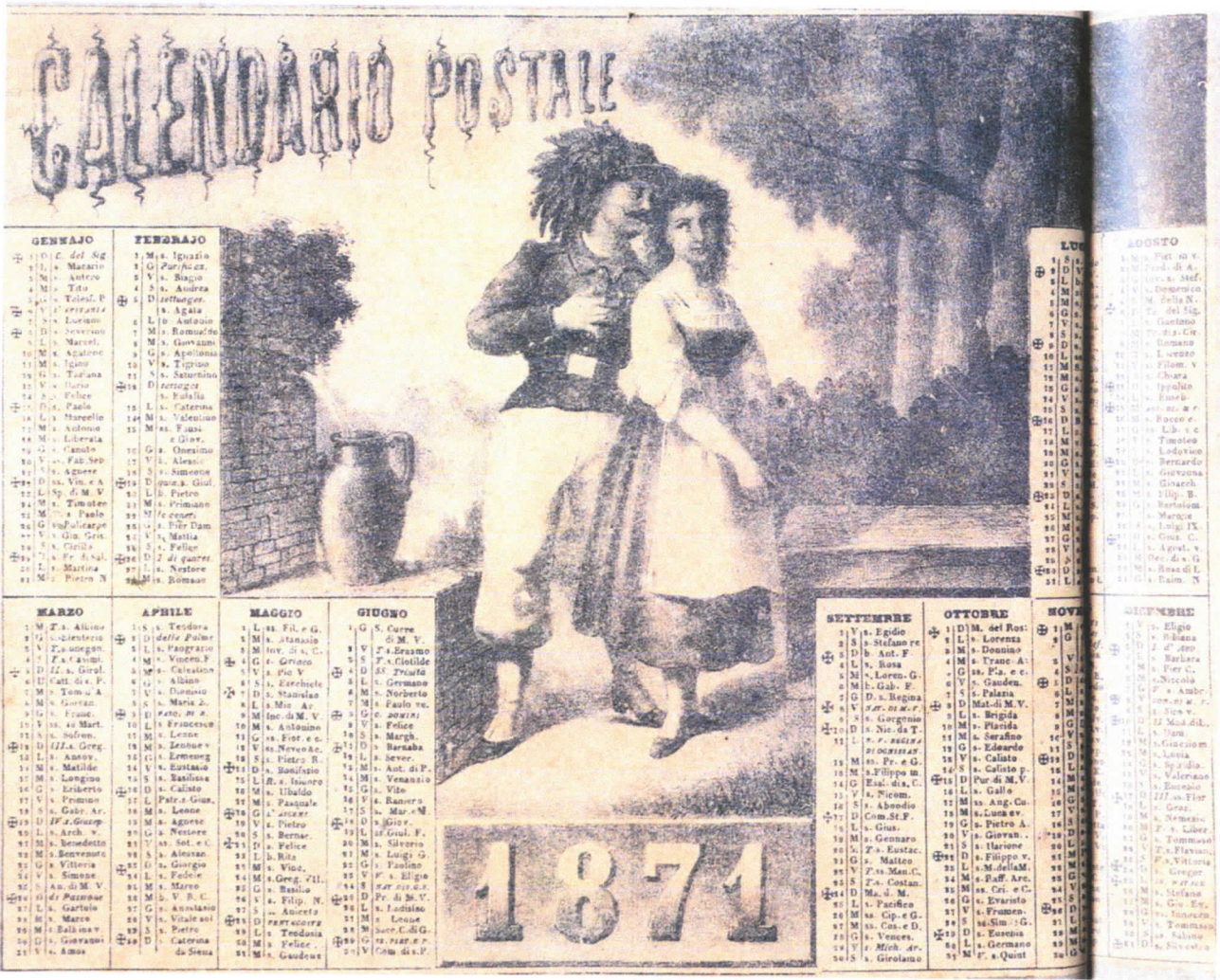
prima edizione del 1871

Stampato dalla Tipografia Manganotti di Ancona.