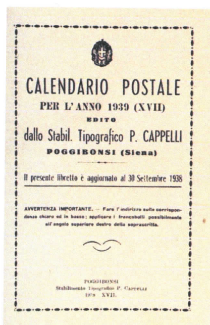
1939 - ultima edizione sconosciuta

La tradizione di fornire notizie sul servizio postale diffusasi negli anni immediatamente precedenti al 1900 - il primo calendario di cui vi è traccia risale al 1871 - è durata pressoché ininterrotta fino all'inizio della seconda guerra mondiale.